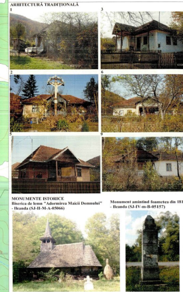
MONUMENTE ISTORICE Biserica de lemn "Adormirea Maicii Domnului" - Ileanda (S.I.-M.A.-05066) Monument amintind fetele din 1814 - Ileanda (S.I.-M.B.-05157)